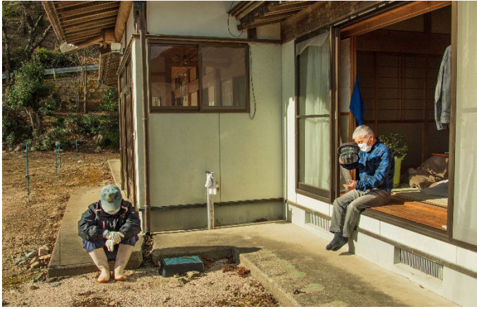
一時帰宅中の方たちと 浪江町の帰還困難区域